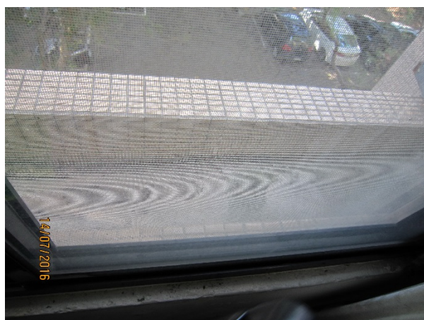
清除花盆、樹葉及垃圾。