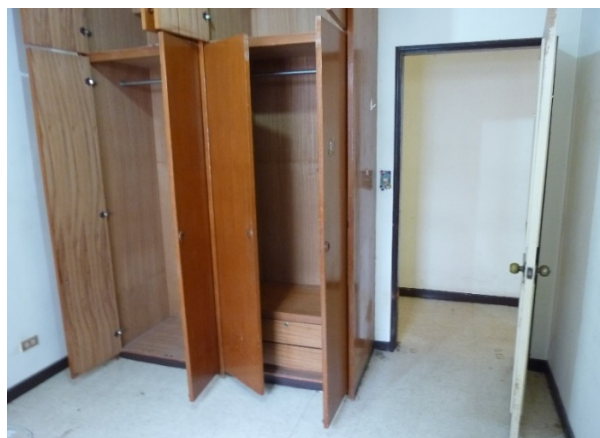
木製櫥櫃：清除衣架、鋪設紙(或海報、貼紙)、芳香劑……等放置物品及垃圾。