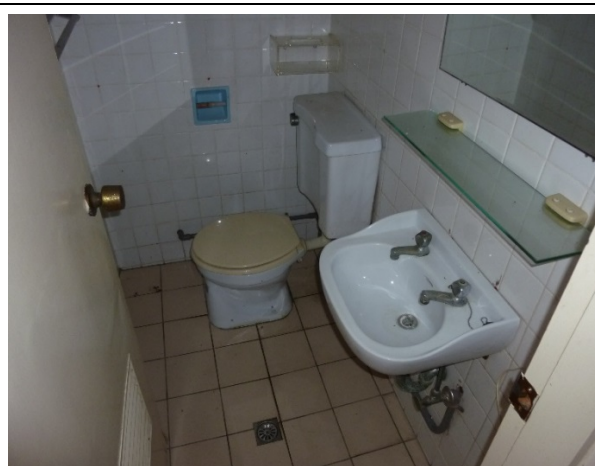
清除浴簾、衛生紙、清潔劑、肥皂、沐浴用品、馬桶刷組、刷子、通馬桶器……等私人使用物品及垃圾。