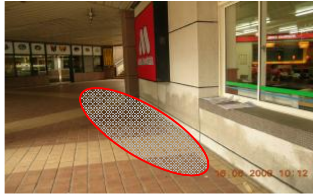
女二舍（B棟）一樓戶外