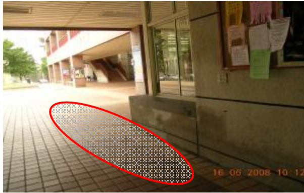
女二舍（B棟）一樓戶外