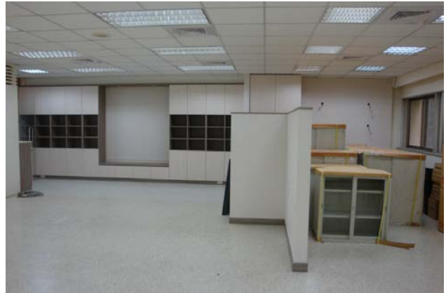
科一館圖示：預計 5 月底完成點交。