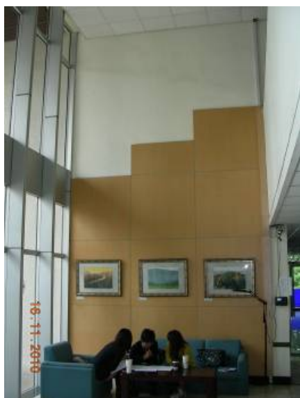
資訊技術服務中心現況