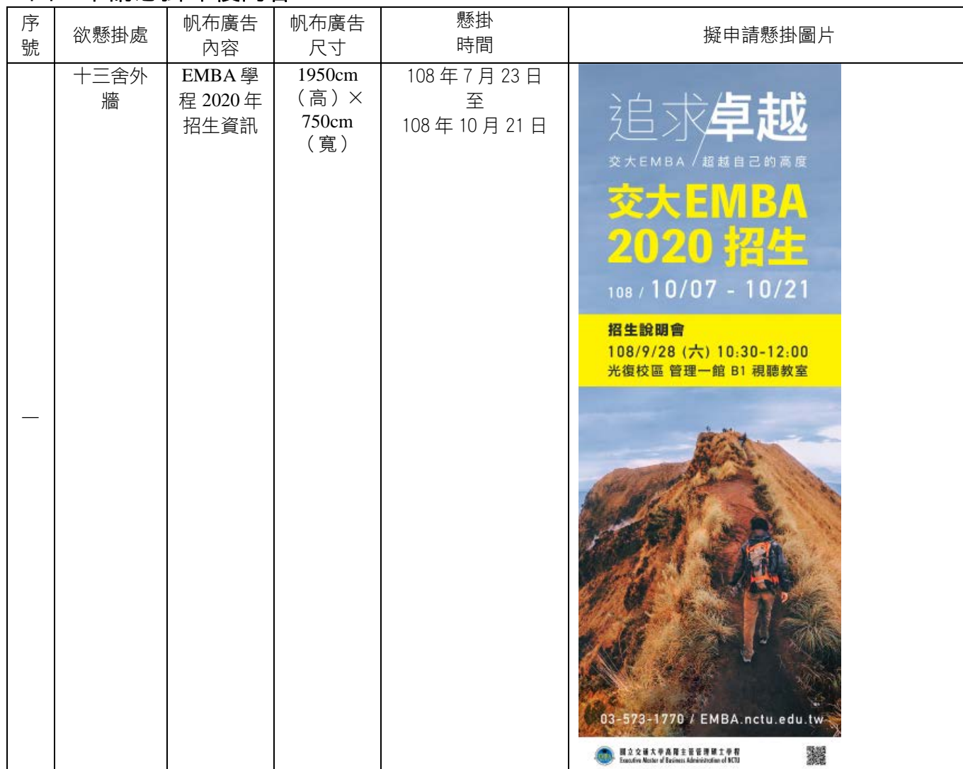
帆布廣告內容(廣告彩樣稿及實景模擬圖)