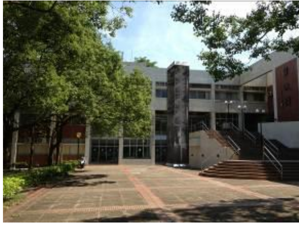
變更室外無障礙電梯位置

( 補充報告： 資訊管電梯如設置戶外，工程預算 330 萬元兩者都差不多，優點是進出動線較為寬一點，且進出均為同一方向。但是目前模擬出來置於戶外的透視圖顯示會很突兀，所以還在評估當中。另外博愛校區教學大樓無障礙電梯預計六月開始發包。)