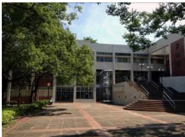
原無障礙電梯預定位置