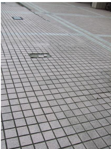
6.6 人社一館旁邊之無障礙坡道，此處落差太大，輪椅容易卡住