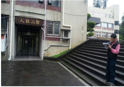
管理一館通往人社二館階梯新增無障礙扶手

2、本校每年編列預算積極針對較急迫性需求之無障礙設施進行檢討改善，106 學年第二學期改善無障礙設施計一處及進行工一館無障礙廁所整修工程。