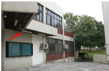
中正堂後方出口加設三盞日光燈

執行情形： 管一館後方已將故障之燈泡更換修復。中正堂後方加設燈具。改善情形如下圖：