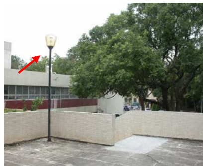
中正堂後方燈泡換新