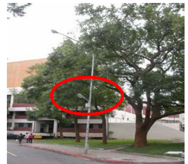
竹軒路燈加設低處路燈