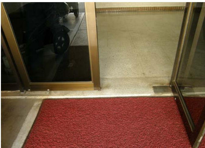
中正堂側門門檻(往殘障機車停車位) 改善前