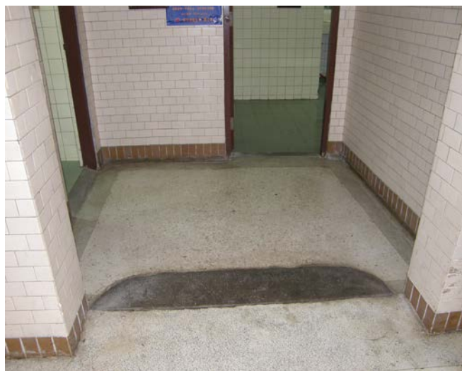
中正堂一樓殘障廁所入口處 (改善前)