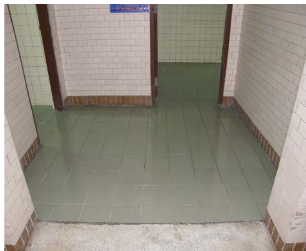
中正堂一樓殘障廁所入口處 (改善後)