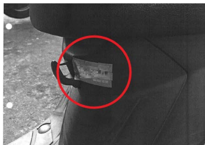
機車座墊桶座下方掛勾旁